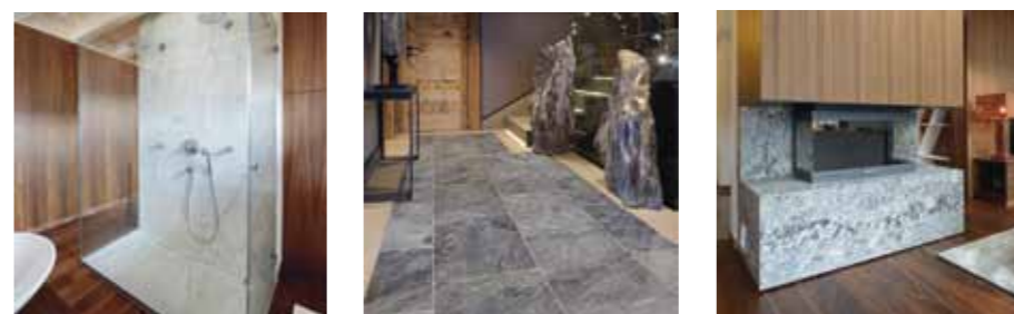
Dallage en marbre Medina White et habillage mural sur-mesure en Albâtre.