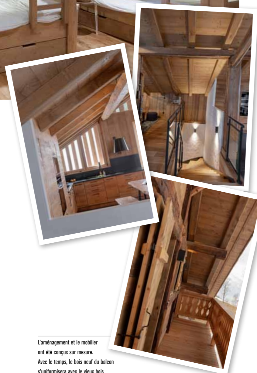
L'aménagement et le mobilier ont été conçus sur mesure. Avec le temps, le bois neuf du balcon s'uniformisera avec le vieux bois.